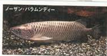
ノーザン・バラムンディー