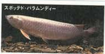
スポッテド・バラムンディー