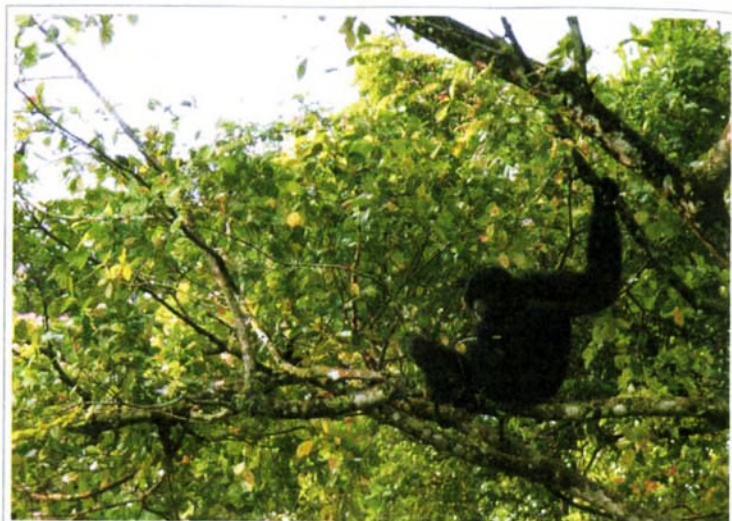
フクロテナガザル(オス)