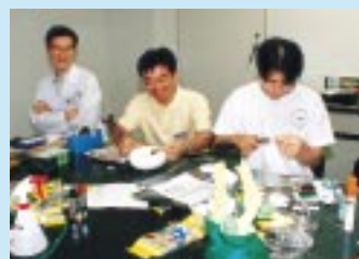
BRHの研究スタッフも楽しんだ。